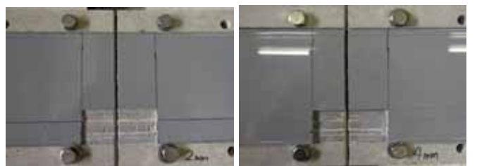
写真 5. ウレタン 2mm