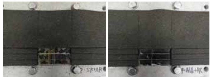
写真 1. SR+AR

発生する工程-ステップが若干遅くなる。一方、シートの厚みが増すほど引張応力が大きくなり下地からの剥離幅が増大する傾向も確認された。ウレタン塗膜防水層においても破断する工程-ステップが若干遅くなる傾向が認められた。ただし、ウレタン 2mm では半幅に渡る破断が認められたが、破断部分の塗膜厚さが約 0.15mm 程度薄く下地ムーブメントの影響が集中したと考えられ、塗膜厚さの影響を考慮する必要がある。